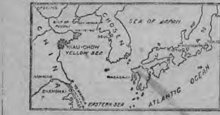
1-TYPE OF JAPANESE BATTLESHIP 2-MAP SHOWING KIAU CHOW, GERMAN POSSESSION 3-COUNT OKUMA