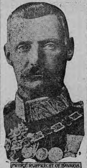
PRINCE RUPPRECHT OF BAVARIA

El Príncipe Rupprecht quien es el jefe del ala izquierda del ejército alemán